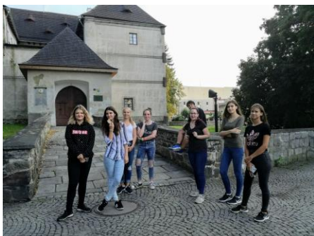
Vycházka po významných místech města Jeseník