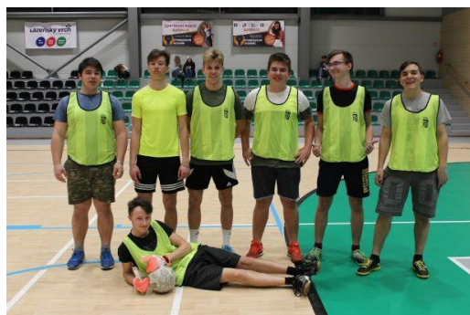
Přátelské utkání v sálové kopané