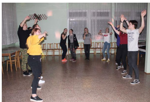
Diskotéka s karaoke – návštěva studentů z projektu Edison